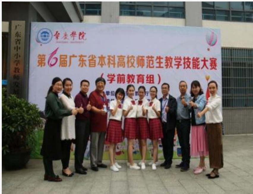
学院师生参加广东省师范生教学技能大赛合影留念（学前教育组）