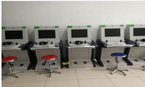
心理基本技能训练室