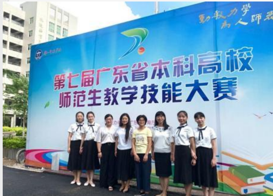
学院师生参加广东省师范生教学技能大赛合影留念（小学教育组）