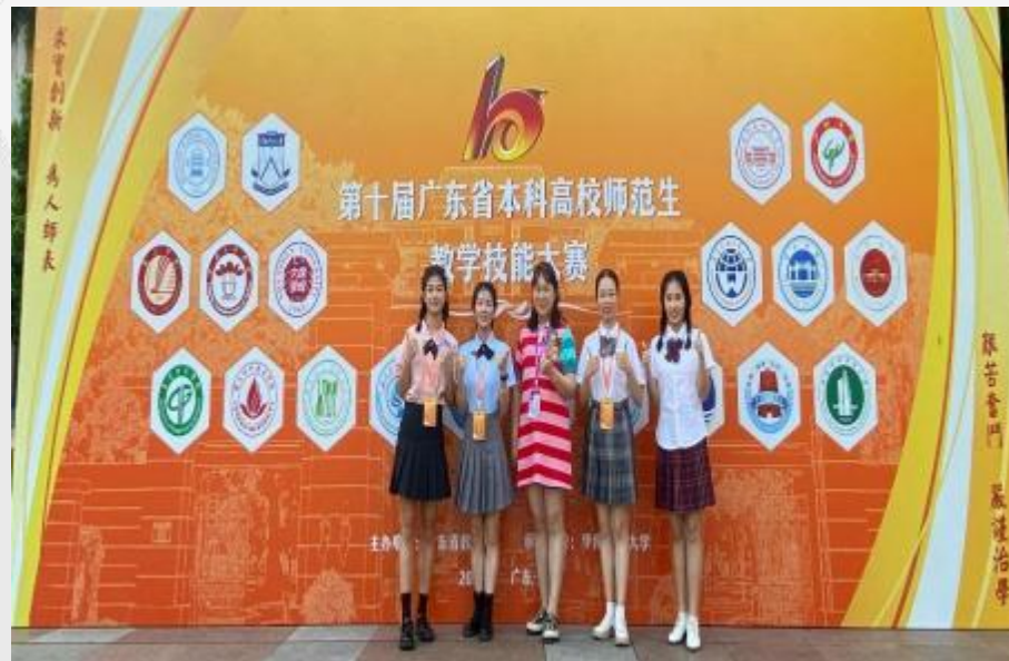
学院师生参加广东省师范生教学技能大赛合影留念（学前教育组）