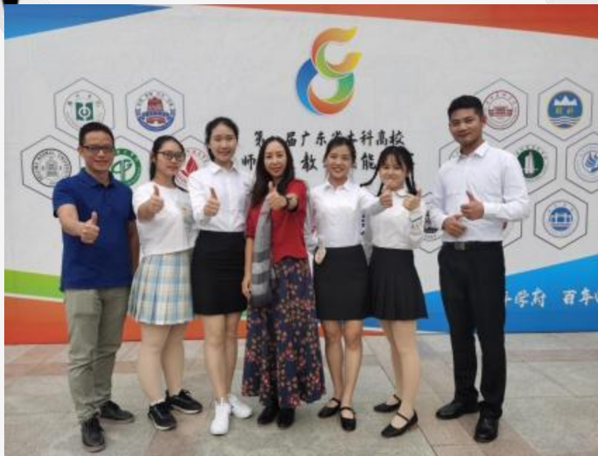
学院师生参加广东省师范生教学技能大赛合影留念（心理学组）