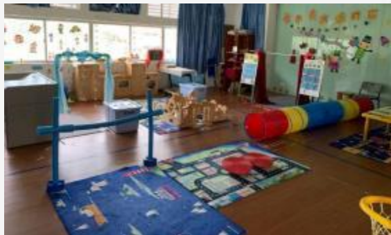
幼儿园游戏实验室