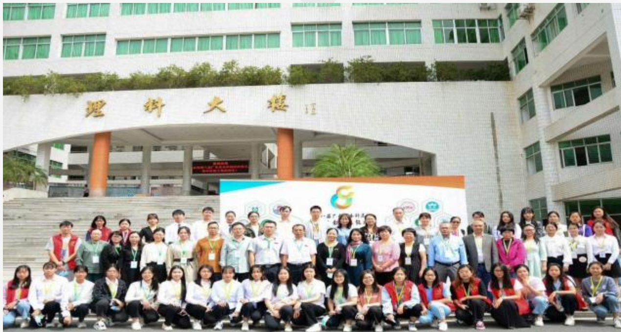
学院师生参加广东省师范生教学技能大赛合影留念（教育技术学组）